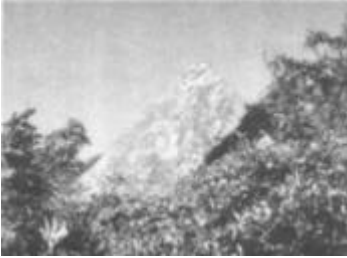
日本五叶山的小金字塔

自 50 年代以来，日本各地陆续发现了大量的金字塔遗迹和巨石建筑，年代相当久远，其中一些金字塔由于表面被灰层和泥土所覆盖，并长满各类植物，外观上看似一座山丘。日本人酒井胜军还发现在远古时代，日本人与犹太人有某种关系。