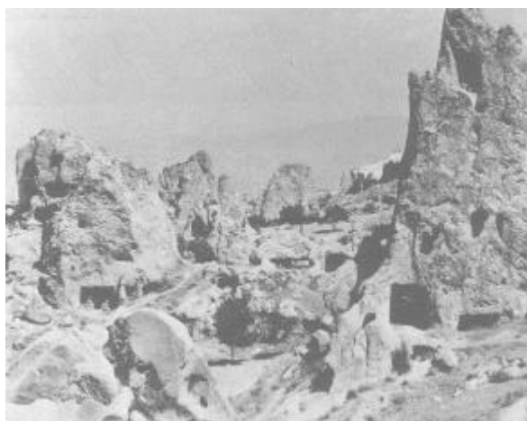
遭古代核战争毁灭的卡巴德奇亚

卡巴德奇亚遗址是一座可容纳数十万人的地下都市，拥有污水处理设备、通风口和炊事场。其生活用具与摩汉乔?达罗文明 (3.7 节) 近似。然而从挖掘出的遗址研究，其呈现出曾遭古代核子战争毁灭的景象 9 。