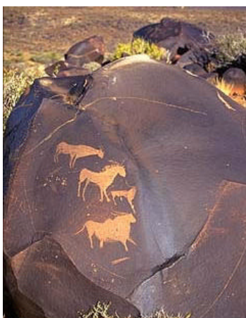
西班牙史前雕刻和绘画