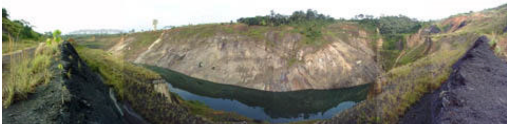
20 亿年前的奥克洛核反应堆遗址

二十亿年前，在今天的非洲加蓬共和国，曾存在着一个大型的链式核反应堆，运转了很多万年 1 16 17 。