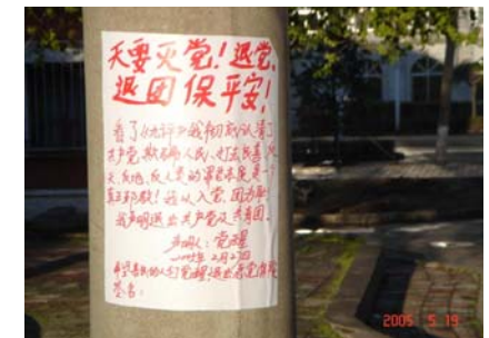
2005年5月25日，法国国际广播电台报道了中国东北哈尔滨市街道最近出现了一些公开宣布退党的声明

《九评共产党》唤醒了中国人民的良知，退党大潮正在解体中共。中国现在的情况可以和德国柏林墙倒塌的前夜相比，也很象前苏联东欧解体前的凌晨。