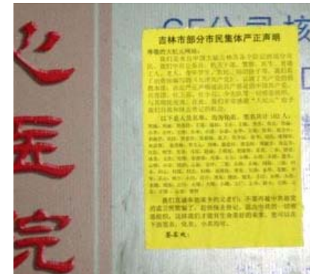
吉林省吉林市10 2 人一道宣布退

二十九个省和直辖市的老百姓通过动态网发表退党申明。来至北京的人数最多， 占总数的15%。