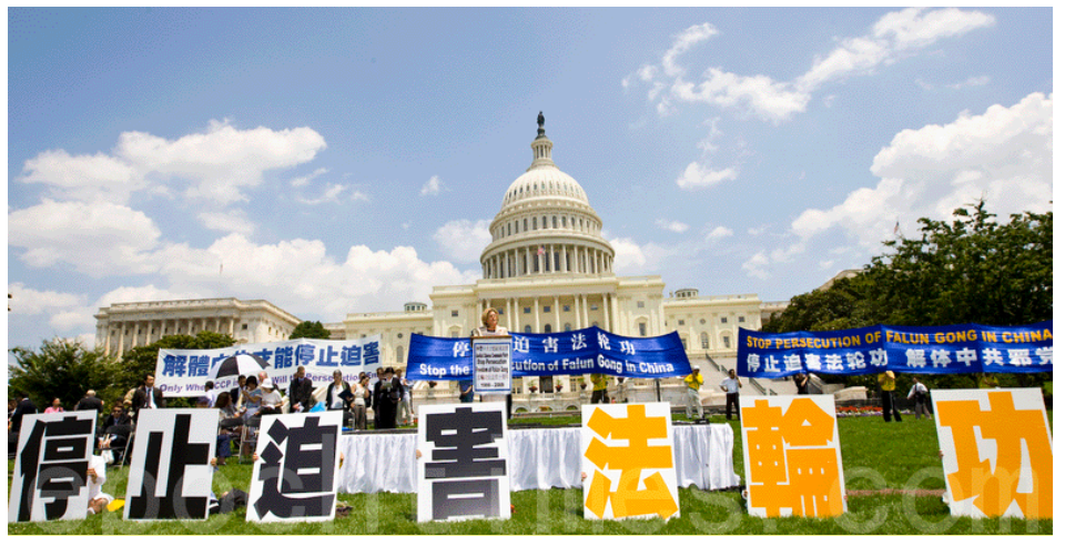
▲ 2009年7月16日，法轮功学员在华盛顿国会山前举行停止迫害大集会。

全国范围内大量法轮功学员继续受到监视、拘留、劳改和在押虐待，有时导致死亡。在这一年中，对未经同意即活体摘取法轮功学员器官的关注继续上升，这些关注包括来自联合国酷刑特别报告员的关