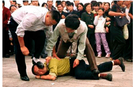
▲ 中共对法轮功超过十年的迫害，即将面临法律的制裁和正义的清算。

并且是第一起将被告罪责迈入刑事实质审理阶段的诉讼案。目前江泽民以非国家元首，不具任何豁免权，并且中国与西班牙于2006年签订引渡条约，西班牙诉江案将对中共高层造成难以回避的强大压力。