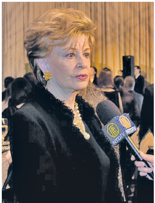
联邦众议员玛德莲·鲍达罗女士

（Bilirakis）观看演出后表示：“非常赞赏这种对传统文化保留与弘扬的演出，中国古典舞太精彩了。”