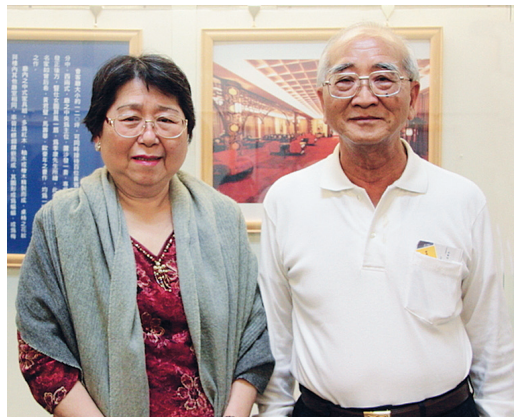
前教育部次长、北市教育局局长林昭贤与夫人蔡东辉。

前教育部次长、北市教育局局长林昭贤伉俪，2010 年 3 月 24 日下午观赏了神韵在台北的第八场演出，“神韵将中华文化推向各角落，这真的是很了不起！”林昭贤对神韵由衷的佩服。