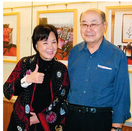
郭美珠女士和夫婿陈苍岭先生

台湾资深演员、电视剧制作人郭美珠女士和夫婿、前台湾电视公司资深导演兼广播陈苍岭先生观看神韵后，表示：“很欣赏神韵新颖、独特的艺术表演风格，这种浓缩、熔炼的中华五千年文明与历史文化精髓的演出，有助于人们了解中国传统文化。希望把这种文化发扬光大。”