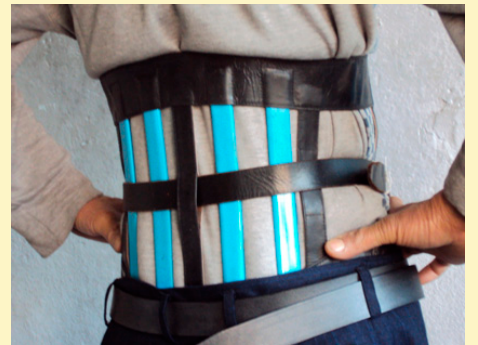
◆ 图二：穿钢背心（后面）

一吃东西就得喝半斤高度酒。我穿着钢背心，每顿饭伴着酒，每两三个月长一次疔毒，吃一茬犀黄丸，同时打着吊针和吃中西药，十多年过着生不如死的日子。虽说是公费报销，到一九九一年犀黄丸涨到一百多元一丸，每年报销一万多元，连医生都向我叫苦了。我说：每天喝一斤多高度酒你还没报销呢。