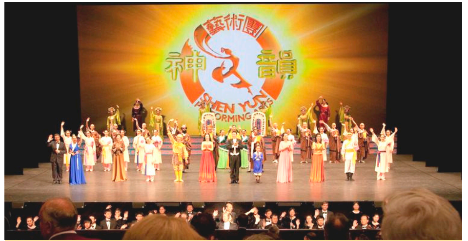
▲ 美国神韵巡回艺术团自今年 3/5-6/16 在欧洲巡回演出，掀起神韵热潮。

上演神韵的剧院发信，先假装表示“感谢”，但是马上就用威胁的方口气让剧院方“修炼、支持法轮功”，否则就会“受到惩罚”、“厄运连连”云云。杨森表示，中共特务用这种鬼话来造谣，和中共喉舌过去妖魔化法轮功的宣传如出一辙，无非是想给剧院方一个错误信息，让他们误以为法轮功学员都是“异类”、“极端的人”，从反面达到干扰神韵演出的作用。