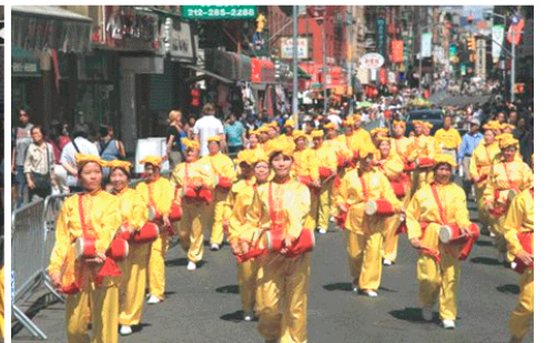
▲9月4日数千名法轮功修炼者在纽约曼哈顿举行盛大游行集会活动。

一位湖南女士走了60多里路才找到国际电话线，在热线上报了40多人的名单要求退出党团队。热线电话常收到大陆民众询问法轮功的真相，如中共为镇压法轮功找借口而制造的漏洞百出的“天安门自焚”事件。也有很多大陆民众打电话表达对法轮功学员无私付出的感谢，以及对李洪志先生的问候。