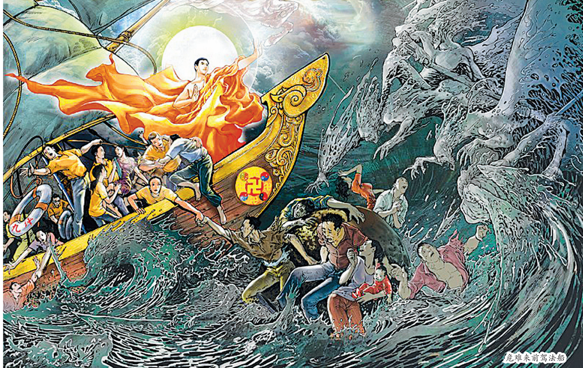
危难来临前驾法船

基督教和佛教都讲了人类的末劫时期，基督教把这个时期称为“末世”，佛教把这个时期称作“末法时期”。两教都预言了在末劫时期会有神降临世间拯救众生。