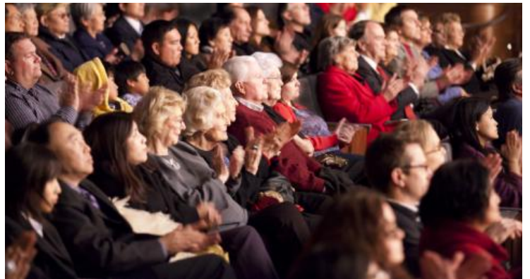
▲观众被神韵艺术团的表演折服，纯善纯美的中国古典舞、正统的中国文化所，让现场掌声不断。

“在国内就听说过神韵的大名，我在国内的家人都想看神韵，他们让我到了美国一定要看神韵。能够有这样的机会，有这样的机缘观看神韵，当然要选坐最好的位置，也是帮国内的家人完成心愿。这样精彩的演出，再贵也值得。”