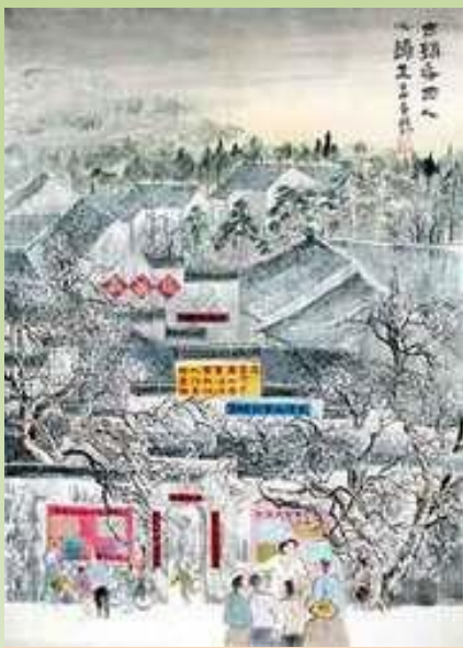
古瑞珍，《古镇春晓》，国画，23.5英寸 x 6.5英寸(2003年)

中国有很多古老的城镇，比如安徽省就有很多，在这些城镇里，每天都在发生着贴真相标语救度世人的感人故事。画中在讲话的人们，他们可能是法轮大法弟子，也可能是明白真相的世人。可能法轮大法弟子在那个场合讲真相，也可能是常人在议论纷纷，有这两种意思。过去大法弟子们是在晚上讲真相，现在他们正念越来越强，白天也公开出来讲真相，这幅画也有这层意思。