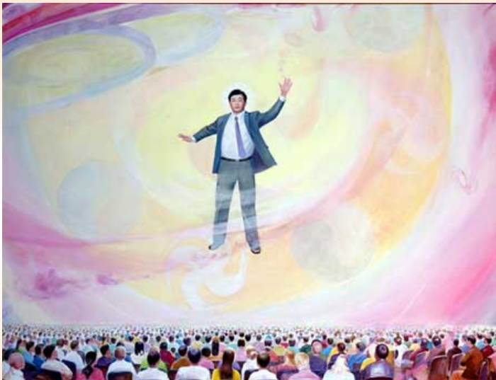
张昆仑，《转大法轮》，油画，82.5 in x 63 in (2004 年)