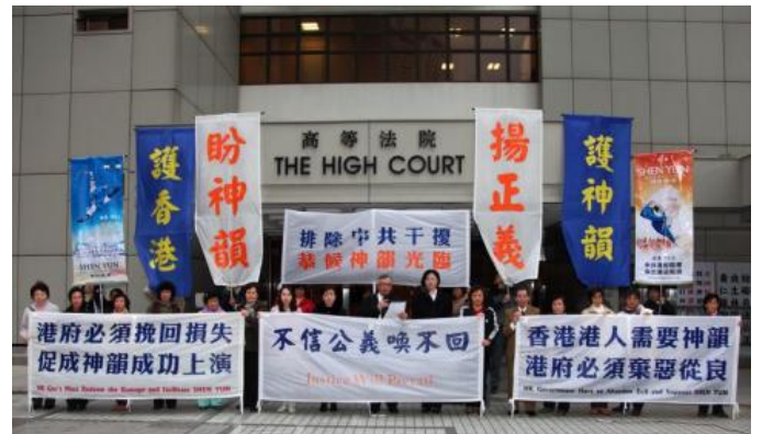
▲今年1月24日，神韵受阻案开审，主办方在香港高等法院外集会，呼吁各界伸张正义，支持神韵艺术团来港演出。

在41页的判决书中，承审法官张举能明确地指出入境处应该视为相关并且予以考虑的两个重点：一个是文化及艺术交流活动对于社会的明显价值；第二是本案的签证申