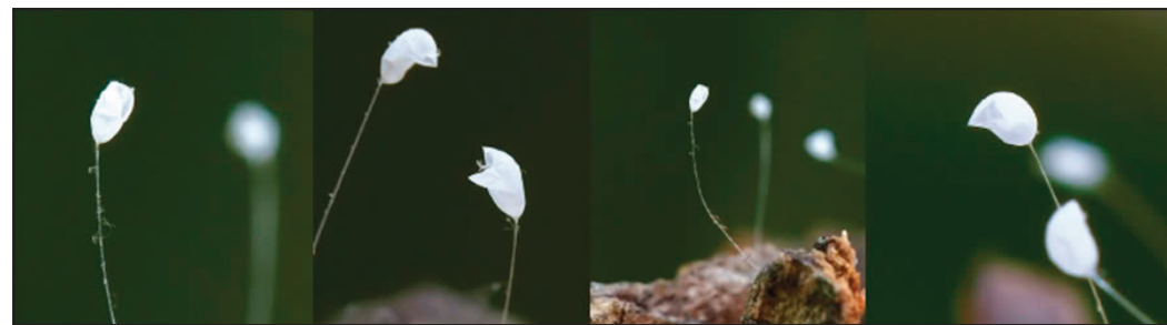
2011年在美国马里兰州盛开的优昙婆罗花

由此，经过这场正邪之战后，能因维护佛法之道义而留下来的人有福了。他们长寿安乐，无罚无灾，花果充实，美味充足，和平相处，没有争斗，人类从此进入了新的纪元。◎（张杰连）