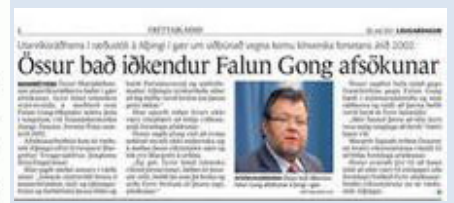
▲冰岛媒体报导，冰岛外交部长斯卡费丁松日前在国会备询时表示，他代表该国政府向法轮功学员道歉。