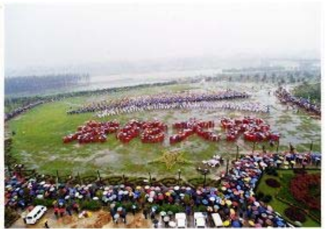
▲99年4月，武汉五千名学员排“法轮大法”字形

98年12月，武汉辅导站做了一个修炼法轮功健康调查。调查小组本着真实、准确的原则，对全市50余个炼功点2005名法轮功学员，在年龄、职业、文化成度、修炼时间、祛病健身效果、医疗费开支及个人不良嗜好等七个方面作了随机抽样调查，重点调查了2005名学员的修炼前后的身体和行为方式的变化情况。然后科学的进行统计归类分析，结果显示炼功后学员的身体变化十分明显，疾病完全痊愈率为