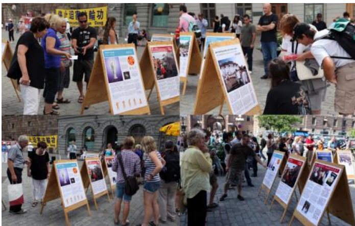
▲2011年7月20日，瑞典法轮功学员呼吁制止这场残酷迫害。

下午的活动是在海滨公园举行，横幅、展板、功法演示、酷刑表演以及围观的人群，成了那里一道特别的风景。很多路人看到展板后主动的上前询问，并签名支持法轮功学员们的活动。签名桌前经常是排着队等待着签名。一天的活动下来，有不少是国外的游客，有瑞典，丹麦，西班牙，荷兰，德国，英国，瑞士，法国等。很多人对学员讲说：“你们做了一件非常有价值的事情。”