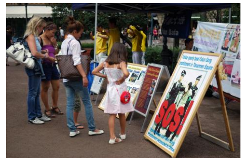
▲许多芬兰民众专心看着真相展板，并签名支持法轮功学员们的活动。

上午在中共驻芬兰的使馆前，芬兰的法轮功学员打出法轮大法好，停止迫害法轮功等多个横幅。学员手捧着被迫害致死的学员们的照片静静的坐着。