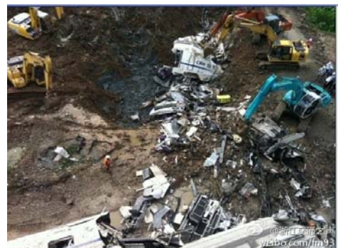
▲温州动车事故现场快速掩埋，引发民众质疑。