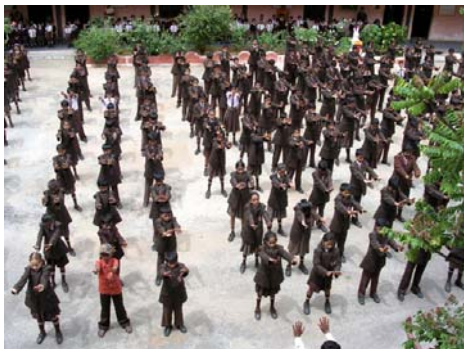
▲印度班加罗尔 CHINTAMANI 镇的 JYOTHI SCHOOL 学校学生集体炼功