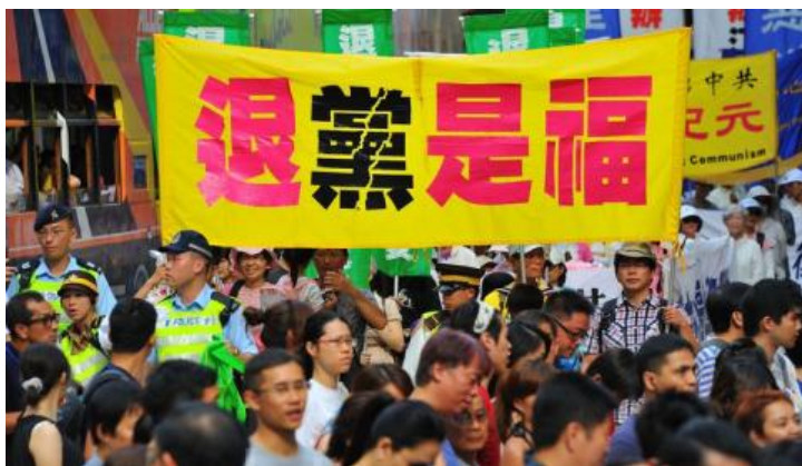
▲香港各界在8月21日集会游行庆一亿人三退

集会结束后，约9百人的游行队伍，沿着港岛区的闹市缓缓前进，揭露中共邪恶及表达真相的各式横幅，沿途吸引许多市民及中外游客观看。游行队伍抵达终点中联办，在代表宣读声明后结束这次活动。