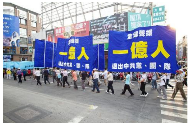
▲全球纷纷举办游行，声援中国三退民众。图为台湾2011年10月8日在高雄的退党游行。

“如果中共官员威胁我们，我们不购买我们的小麦、木材或铜，那么他们就必须去世界市场购买。他们无论如何都要买这些东西。但是，我不认为我们在同中方交往时，要向其俯首帖耳，并试图掩盖他们侵犯人权的问题和我们的担忧。”