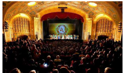
▲神韵精彩的演出，让底特律的观众惊呼连连。

韵，因为能把五千年文化的精髓通过一台晚会展现出来，神韵真是太出色了，很容易让人理解其中的故事，而且美丽非凡。当你走出剧场，你带走的是不可言喻的内心触动。” “我明年一定会再来看神韵，而且我会带朋友和孩子们都来看，尽管这旅程需要开车五小时，但这实在太值了，我下次还会这么做的。”