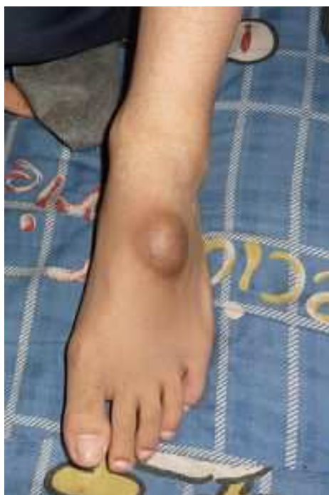
▲ 2011年4月拍的照片：脚上如核桃大小的硬鼓包

当时因为每周要定期到医院诊治，母亲带他就近居住在亲戚家，亲戚家有人修炼法轮大法，且经常有法轮功学员来往学法，他们经常告诉小何一些大法真相和修炼大法后祛病健身的神奇故事。