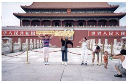
天安门前和平上访的法轮功学员

加拿大法轮功学员泽农曾写下《我为什么去天安门广场》一文，文中说：“法轮大法来自于你们的家乡——中国，来自你们那博大精深而又美好的文化。没有大法，就没有今天的我。就是带着这份深深的敬意，我踏上了你们的国土，为你们而来，向你们讲清真相。我希望通过我这张西方的面孔和纯净的心，能够唤醒你们心中的善念。请不要追随江泽民及其帮凶迫害法轮功，因为这会使你们陷入灾难。我不反对中国政府，也不反对中国。实际上，自从修炼法轮功以来，我已对中国文化和中国人民有了更深的理解。这也是我觉得我必须去中国的原因。”