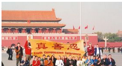
三十六名西人法轮功学员去北京天安门证实大法、抗议迫害

英雄，将永远被记载于未来的中国文化和世界史册之中。亲爱的朋友，我跨越千山万水来到这里，就是想告诉你：你也同样希望在历史中作为正的生命被后人记住。你也一定听说过‘善有善报，恶有恶报’的道理，不要忘记，你的未来亦遵循这样的法则。”