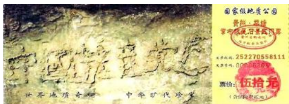
平塘 县风景区 门票上的藏 字石