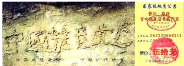
平塘 县风景区 门票上的藏 字石

个清晰的大字“中国共产党亡”，经各路权威考证这六个字是纯天然形成的，没有任何人工雕凿的痕迹，这块藏字石和邵玉清梦中所见预言火灾的牌子一样，都是预言未来必有之事。为什么上天要让人知道“中国共产党亡”呢？因为每个曾加入过党、团、队的人都曾发过为中共“牺牲一切”之类的毒誓，而人的誓言和人的行为一样在另外空间里都是有记录的，要算数的，那么这些人在中共灭亡时，就会真的成为其牺牲品，和中共一起毁灭。所以老天爷大慈大悲特地把“中国共产党亡”的天机通过藏字石显现给世人，要所有曾误入中共组织的人赶快声明退出党、团、队（可用化名），废除毒誓，这样就不会成为中共的殉葬品，从而成为一个拥有未来的人。