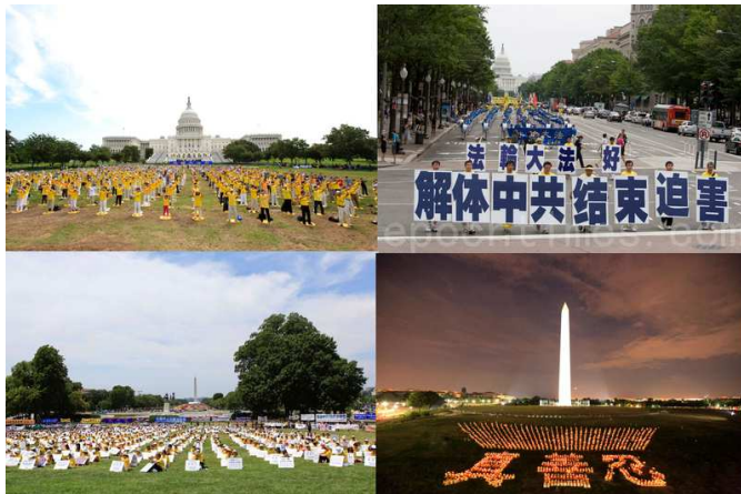
▲7月12日、13日，各族裔的法轮功学员汇聚美国首都华盛顿 DC，参加连续两天的大规模游行、集会。

库玛博士说，“13年以来，这样的罪恶还在发生着，法轮功学员依然在承受迫害，这真是一种耻辱。我会继续奋战，你们也会继续奋战，让我们一起努力。”