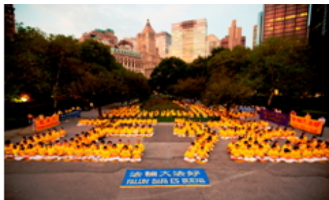
数百名来自台湾、欧洲和纽约当地的法轮功学员在曼哈顿炮台公园举行排字与炼功，场面祥和。

但是还有一个事实摆在了世人的面前：就在政府组织民众撤离时，来自世界各地的法轮功修炼者却纷纷赶赴纽约。据大纪元报导，八月二十六日，数百名来自纽约、台湾和欧洲的法轮功学员在纽约曼哈顿炮台公园集会。他们身穿色彩鲜艳的亮黄色上衣，伴随着悠扬古朴的音乐，在炮台公园的草地上整齐地炼功，并排出壮观的“正法”二字。就在飓风转回海上，人们还在往家赶的时间里，八月二十九日，纽约国际法轮大法心得交流会圆满召开，与会的法轮功修炼者达五千多人。