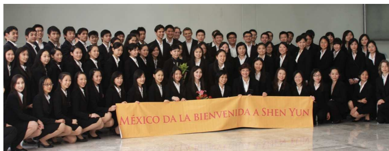
神韵首次莅临墨西哥

当天的新闻发布会吸引了近20家墨西哥主流电视、报纸、电台等新闻媒体前来采访报导，包括墨西哥最大的国家电视台 Teleisa 等等。新闻发布会现场气氛热烈，记者席间不时爆发出阵阵热烈的掌声。