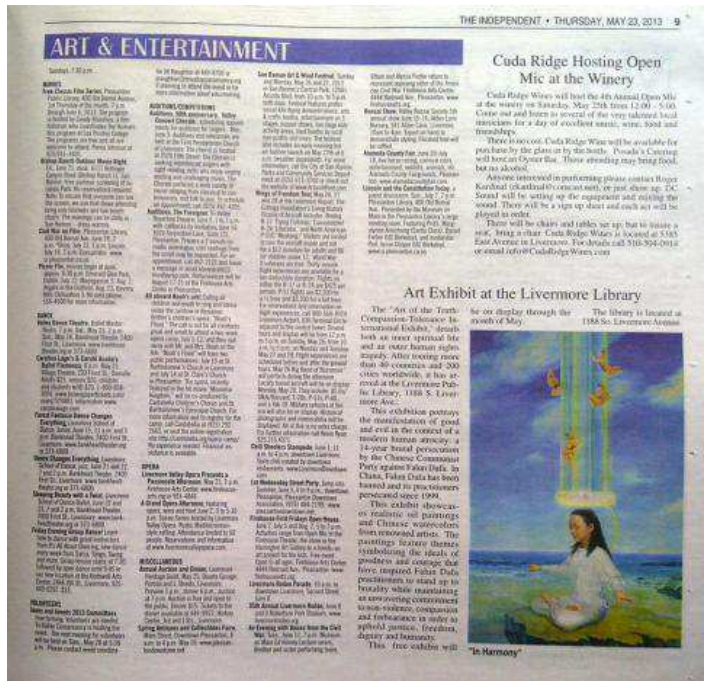
▲利弗莫尔市当地报纸“ The Independent ”对真善忍美展的报道

直到最后一天，仍有不少民众赶来观看美展，他们希望法轮功学员能够在当地举办更多这样的活动，帮助美国民众了解在中国发生的迫害，唤醒良知，从而帮助制止迫害。