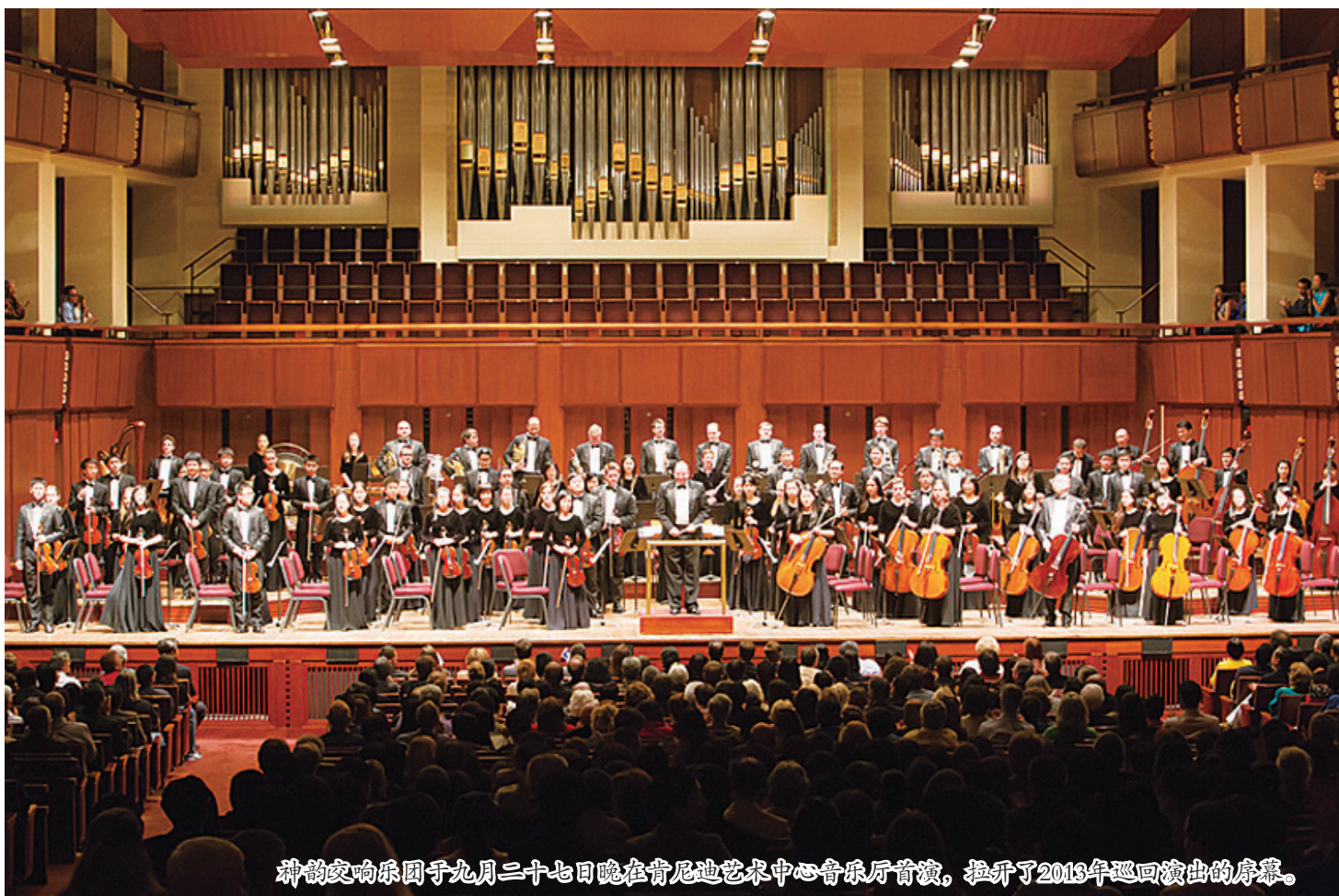
神韵交响乐团于九月二十七日晚在肯尼迪艺术中心音乐厅首演，拉开了2013年巡回演出的序幕。

常优美、感人、充满精神内涵和韵味，她使我得以认识和欣赏到音乐与文化的更多层面，使我对传统乐器和音乐家们升起更高的敬意。”（神韵）音乐确实是上天所赐礼物，确实如此。”