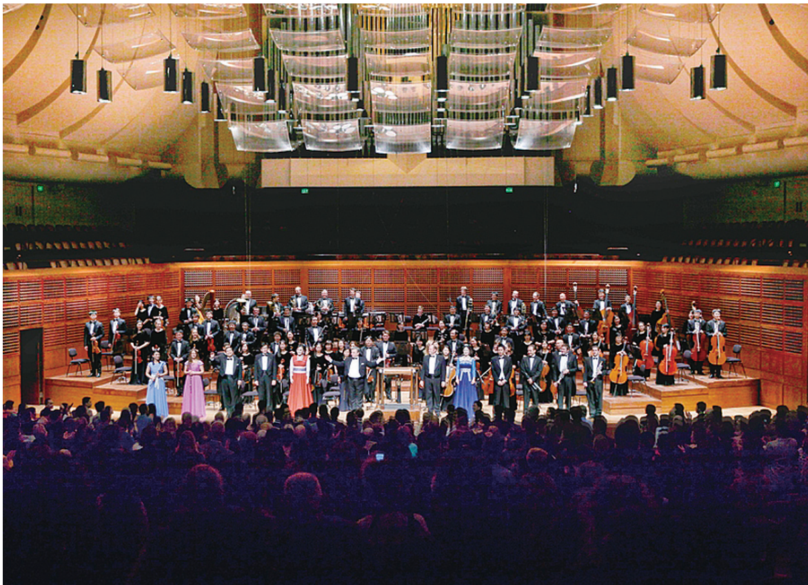
10月22日晚8点,神韵交响乐团在旧金山戴维斯音乐厅(Davies Symphony Hall)的谢幕照

神韵交响乐团巡演自从9月27日在华盛顿特区肯尼迪艺术中心(The John F. Kennedy Center for the Performing Arts)拉开序幕后,继而在纽约、波士顿、休斯顿、达拉斯、洛杉矶和旧金山进行了十场巡回演出。演出在各个城市高潮迭起,惊艳乐坛。每个曲目结束后,剧院内掌声雷动,喝彩连连,气氛热烈非凡。每次演出结束后,现场观众全体起立长时间鼓掌,四位神韵指挥家在观众雷鸣般掌声中再加演四首曲目。最后在加州两个城市大洛杉矶地区的橙县艺术中心音乐厅(Segerstrom Center for the Arts)和旧金山戴维斯音乐厅(Davies Symphony Hall)的演出更是震撼全场观众,掌声经久不息。此次巡演是继2012秋纽约卡耐基音乐厅(Carnegie Hall)成功首演后,该团首次在美国巡回演出。