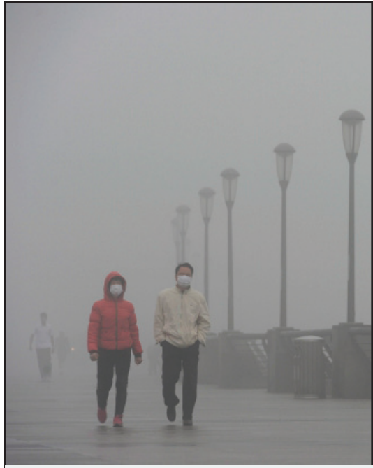
2013年以来，大陆多地频现严重雾霾天气，大半个中国陷入了「十面霾伏」，而且雾霾天气中还有呛人、腥臭的味道。

中国传统文化认为“天人合一”，宇宙和人是一个整体，天体宇宙时空和地球时空是对映关系。人类的行为可以影响天象。人顺天而行，天现吉像，预示人间风调雨顺、国泰民安；反之天现凶兆，人间就会有灾害异象。