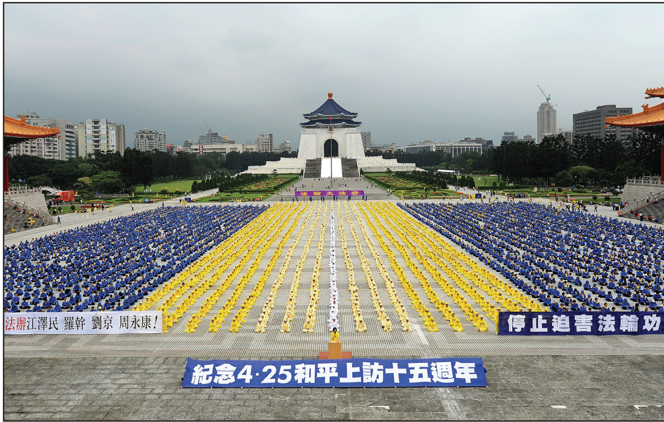
台湾法轮功学员4月26日在台北中正纪念堂举办吁请各界协助制止中共活摘法轮功器官暴行暨纪念“4.25”万人和平上访十五周年记者会。

但何祚庥不甘心于失败，1999年4月又通过天津教育学院的杂志发表文章，将明显违背法轮功原则的表现归罪在法轮功头上，暗示读者修炼法轮功会出大问题，甚至导致亡国。这使得天津的法轮功学员再次去杂志社澄清真相，结果遭到警察镇压。4月23日，法轮功学员被强行驱散，45人被抓，更多人被打。法轮功学员并被告知，这是北京来的命令，必须到北京去才能解