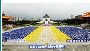
台 6 千法轮功纪念 4·25 集会