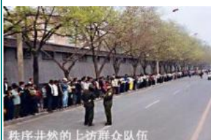
秩序井然的上访群众队伍