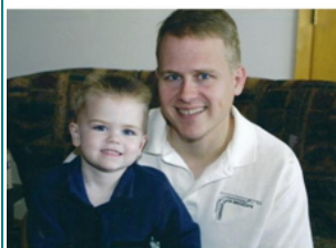
复活节前夕 好莱坞影片 披露耶稣在天堂的相貌