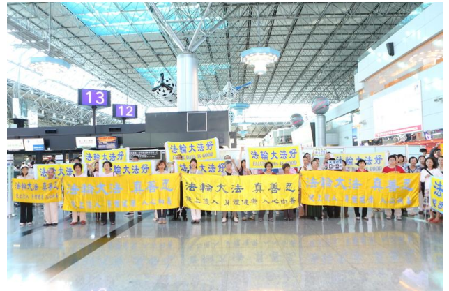
(右图) 80 名法轮功学员机场大厅拉起法轮大法好横幅，大声呼喊“法轮大法好，中共停止迫害法轮功，停止活摘器官”，要中共和国台办主任张志军听到后，把这个讯息带回中国。