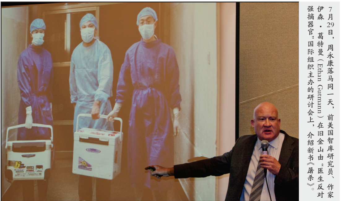
7月29日, 周永康落马同一天, 前美国智库研究员、作家伊森·葛特曼 (Ethan Guttmann) 在旧金山由: 医生反对强摘器官: 国际组织主办的研讨会上, 介绍新书《屠杀》。