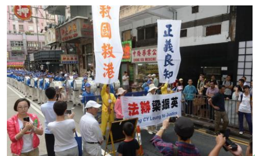
10月1日，香港法轮功学员举行“正义良知 解体中共”集会游行