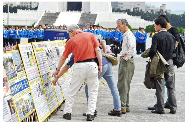
左图：近六千名法轮功学员排出“佛光普照 礼义圆明”图像 右图：大陆游客认真读看法轮功真相图片