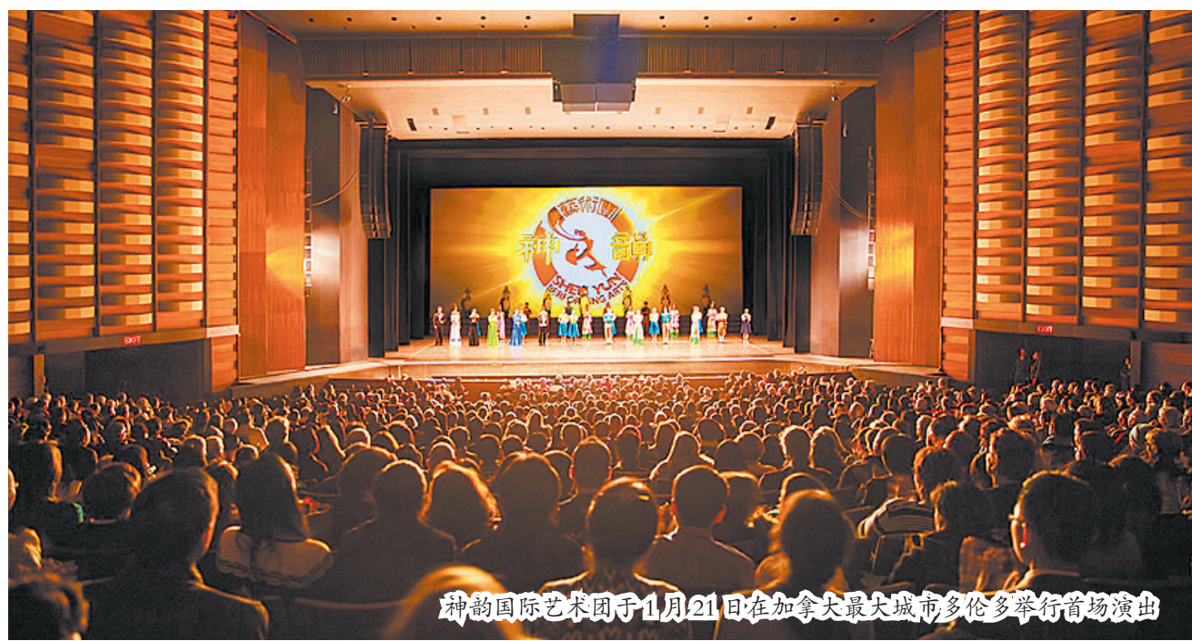
神韵国际艺术团于1月21日在加拿大最大城市多伦多举行首场演出

他提高嗓门说：“太棒了！”“这是真正的艺术！这是艺术！而且是从（神韵演员）他们心里发出来