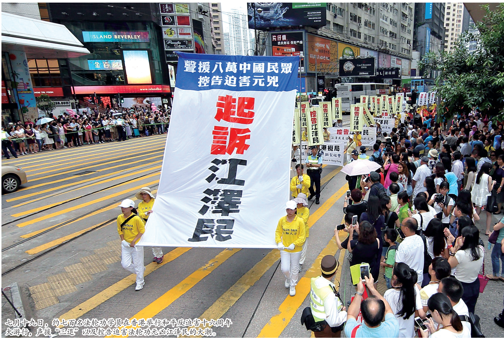
七月十九日，约七百名法轮功学员在香港举行和平反迫害十六周年大游行，声援“三退”以及控告迫害法轮功元凶江泽民的大潮。

16年前的7月20日，是中共江泽民集团发动对法轮功残酷迫害的日子。每年的7·20期间，世界各地的法轮功学员举行各种集会和烛光夜悼，呼吁解体中共，结束迫害。这16年来，上亿法轮功学员不惧危险，不畏艰难，和平理性地坚持着反迫害，讲真相、劝三退，至今有2亿多人退出中共的党、团、队（三退）。