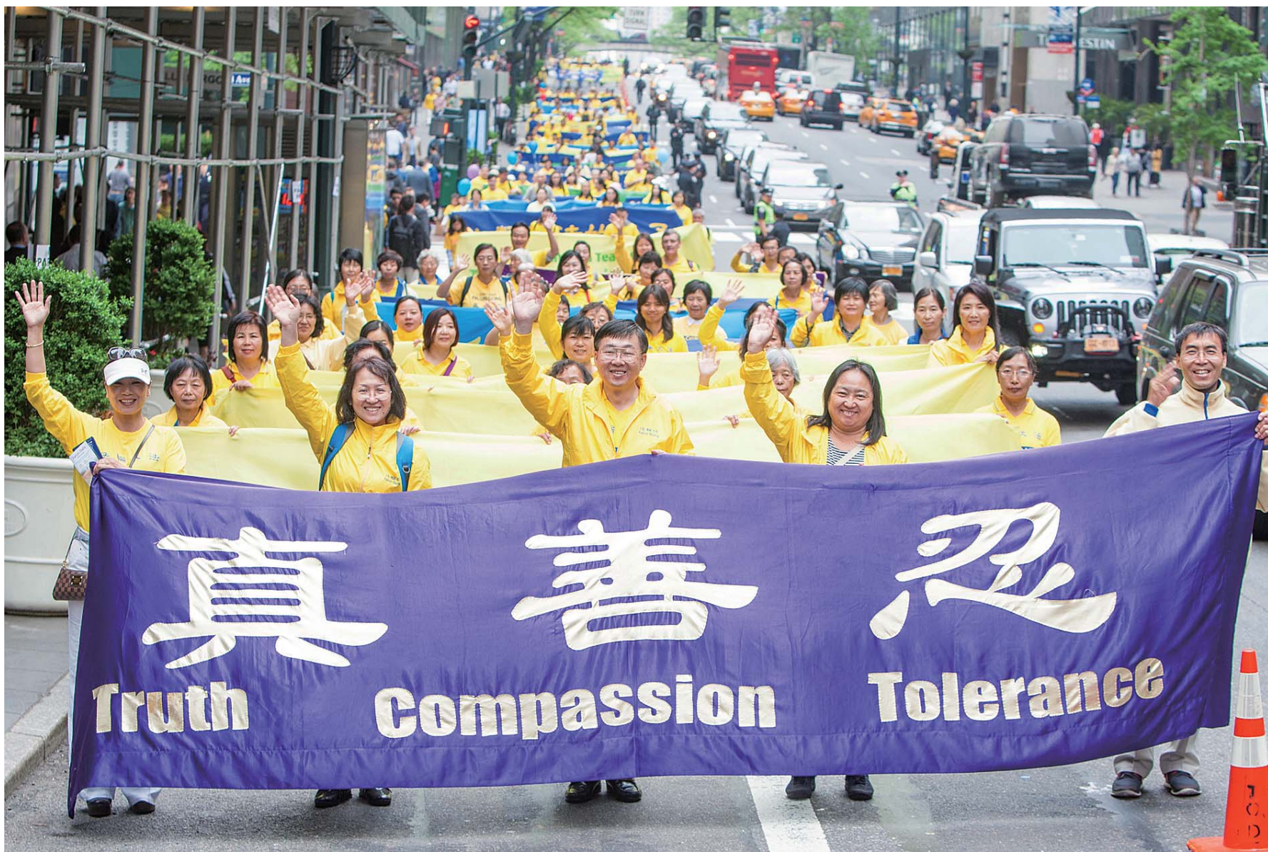
2016年5月13日，近万名来自53个国家的部分法轮功修炼者会聚美国纽约市，在曼哈顿举行盛大游行，庆祝第17届世界法轮大法日。