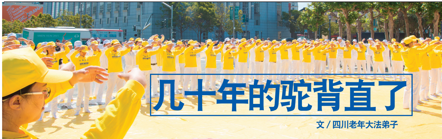
文 / 四川老年大法弟子

我家在农村，一九九七年八月开始修炼法轮功后，慈悲的师父为我净化身体，折磨了我几十年的驼背直了，我从新得到了一个健康标准的身躯。