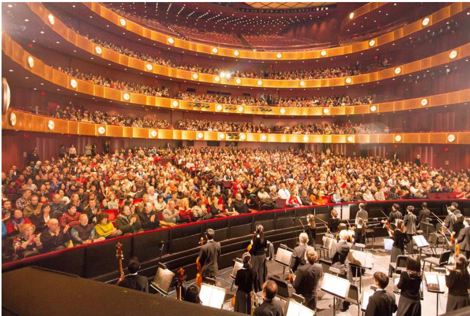
▲ 15 日，神韵国际艺术团在纽约林肯中心大卫寇克剧院的演出，持续爆满。

1 月 15 日，神韵国际艺术团在纽约林肯中心的演出进入最后一天。除了下午场爆满之外，一周前临时加场的晚场也爆满。演出结束后，纽约人表达了不舍之情，希望神韵在纽约至少连演一个月。