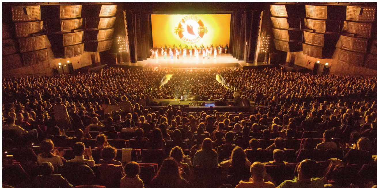
4月22日神韵世界艺术团在巴黎国际会议中心爆满的盛况。图为演出结束时神韵艺术家们谢幕。

Adler 先生表示神韵所展现的美集合了人类历史的精华，“我认为他们从历史中挑出了各种最美的元素，这种美是永恒的。现场乐团的演奏美妙动人，那个音乐、那个舞蹈……整个色彩主题宛如平和的合音。”