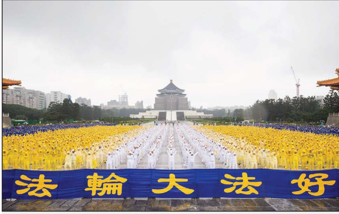
约6400名来自台湾及世界各地部分法轮功学员，11月25日齐聚在中正纪念堂排字。图为法轮功学员演练功法

逾800位法轮功学员被中共非法判刑，包括年逾古稀的老人。与此同时，多人在被关押期间，遭酷刑折磨，致瘫痪、命危。