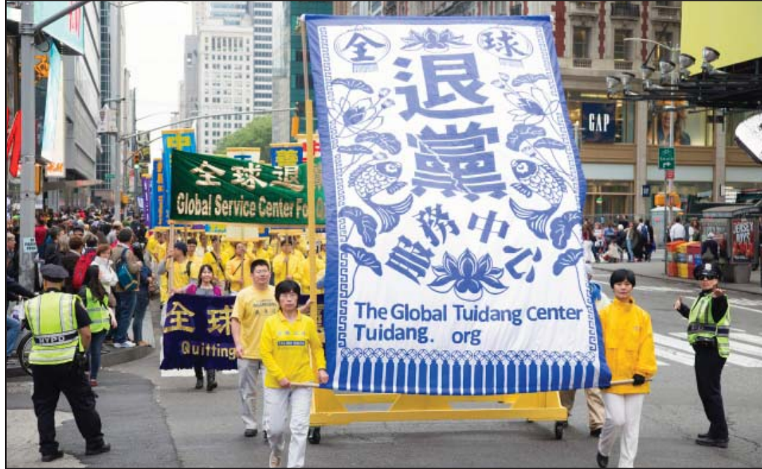
中国大陆异议人士荆楚说，法轮功学员的“三退”是一件很值得的事，是“人心所向”。图为法轮功学员2016年纽约曼哈顿大游行。

中共为维护其统治，从来不去身体力行教育人们重德行善，以善为本去善化矛盾。它就是以暴政、杀人来巩固政权，把它的斗争哲学运用得炉火纯青。当初坑害穷人杀富人，后来又利用富人害穷人。当初中共为窃取和稳固政权，坑害穷人夺江山，打土豪分田地，杀资本家，杀工商界人士，甚至杀一切有钱人。后来中共整个体制内腐败堕落，各级贪官欲壑难填，都在无所顾忌地去抢掠百姓的财产，榨取百姓的血汗。特别到了江泽民时代，各种摊派提留，使众多农民劳作一年分文不剩，计划生育极端一胎化，把那些超生者罚得倾家荡产。摊派提留、计划生育罚款等，大部分的钱都落入各级贪官的腰包。而现如今，贪官们更是不肯放过任何一个榨取百姓血汗的机会。