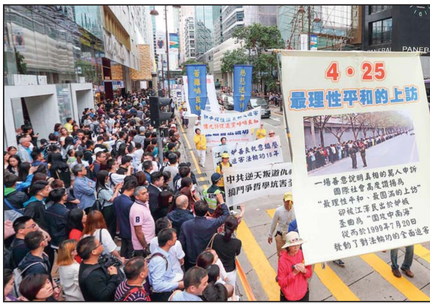
2018年4月15日，法轮功学员在香港举行游行，纪念“四·二五”和平上访19周年

19年前，4月25日，在中国北京，一次史无前例的和平上访，震惊中外。在中南海国务院信访局附近，府右街、文津街旁，一万多名群众排起了长长的队列，秩序井然、安静祥和。他们来自北京、天津、河北、东北等地，此行的目的，是要求当局释放被抓捕的45名天津法轮功学员，要求合法的修炼权利。