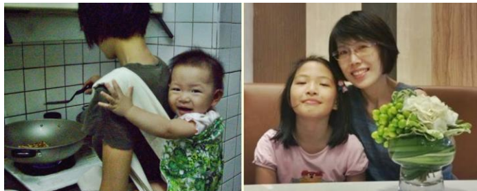
▲（左图）女儿小时候背着她做饭。（右图）女儿长大后的合照。

身体最严重的问题是，医生说恐怕我无法生育，然而我修炼几年过后，却在 36 岁高龄自然产，生下了第二胎。