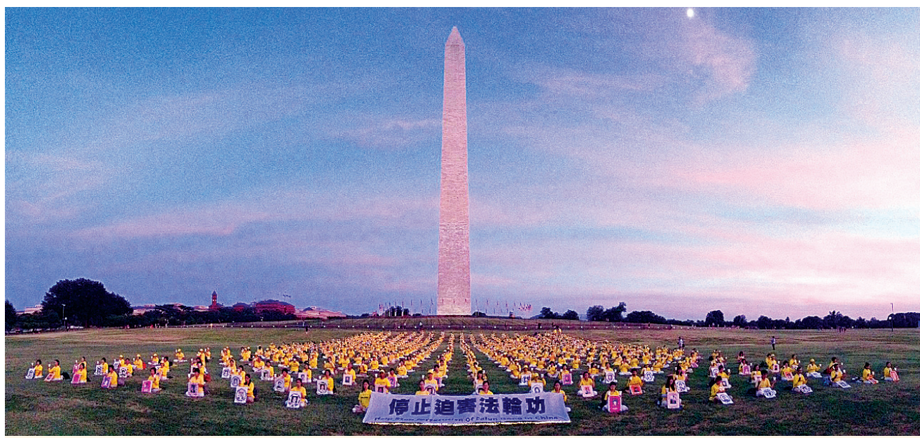
2018年7月19日，美国东部的部分法轮功学员在华盛顿纪念碑前举行“720”反迫害活动，呼吁停止迫害法轮功。

“在大陆不允许发出声音，天安门广场那么多法轮功学员被抓、被打。想到还在被关押法轮功学员、被迫害致死的法轮功学员，我