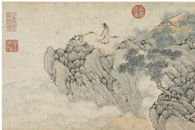
明 文伯仁《丹台春晓图》

从此诗可以看出，李白从青年时代就已经热衷于访道求仙，对于修炼人的生活充满向往和崇敬，就连修炼人居住的环境也在他的笔下变得格外优美，并且带着一种超凡脱俗的仙境气氛。访道求仙甚至亲自炼丹修行的实践在李白一生中从未间断过。虽然史书上并未明确记载他最终的归宿，但他辞世的特殊方式始终是不解之谜。