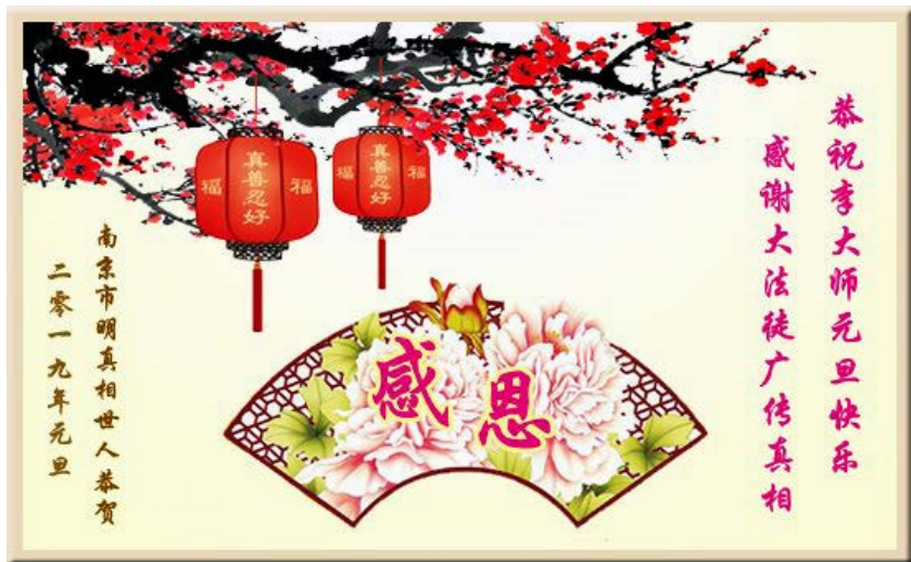
▲江苏省南京市明真相世人恭祝李大师元旦快乐！感谢大法徒广传真相！