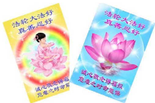
▲法轮功学员自己制作的，上面写着“法轮大法好、真善忍好”的护身符。

2017年12月10日下午六点多钟，突然有个电话打来，退休的区信访局长说要来找我。因她心脏过去做过手术，上着两个支架，我赶紧下楼接她，她却坚持爬六楼到我家去说。